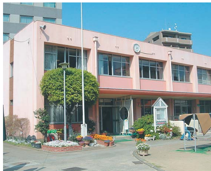
①管理棟・遊戯施設(昭和46年完成) 建築面積 441㎡ 延床面積 602㎡ 階数 地上2階 構造 鉄筋コンクリート造

所在地：熊本市城東町5番9号 敷地面積：4,632㎡ 都市計画区域：都市計画区域内 市街化区域 地域地区：準防火地域 駐車場整備地区 用途地域：商業地域(建ぺい率80% 容積率400%) 日影規制：なし その他の地域：公害防止地域(騒音、振動、悪臭) 地震地域係数：Ⅱ種 地盤種別：Ⅱ種 積雪寒冷地域：その他 海岸からの距離：8km超