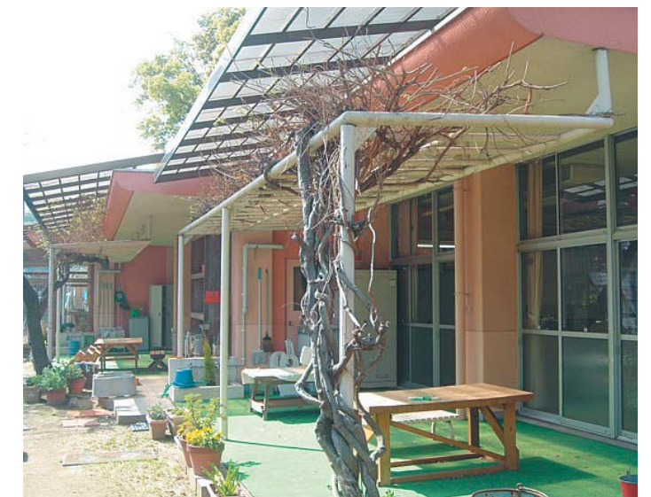
③保育室B棟(昭和46年完成) 建築面積 229㎡ 延床面積 229㎡ 階数 地上1階 構造 鉄筋コンクリート造