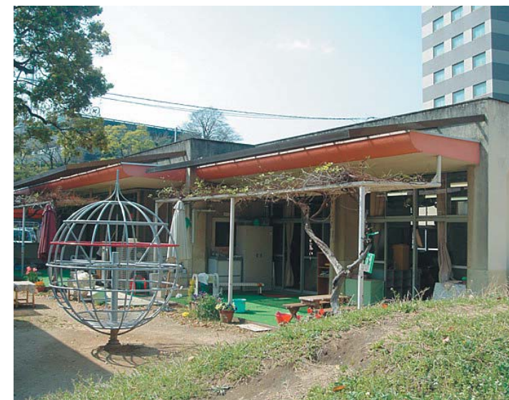
②保育室A棟(昭和46年完成) 建築面積 175㎡ 延床面積 175㎡ 階数 地上1階 構造 鉄筋コンクリート造