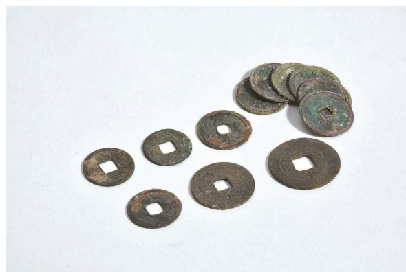
写真2 近世～近代の六道銭