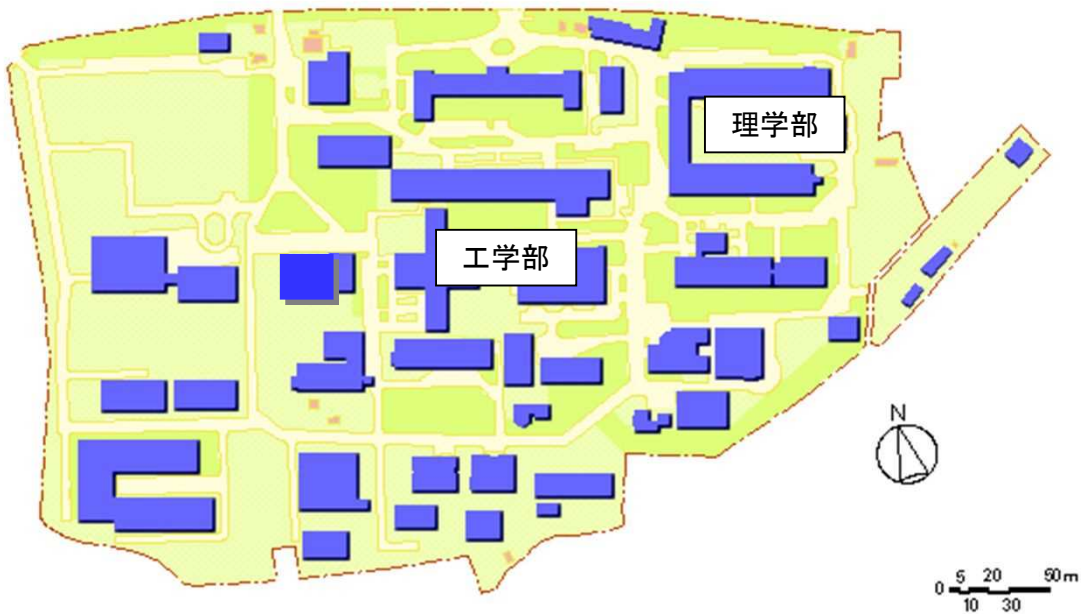
黒髪南キャンパス